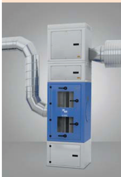
FILTERCUBE 4H aus System PushPull